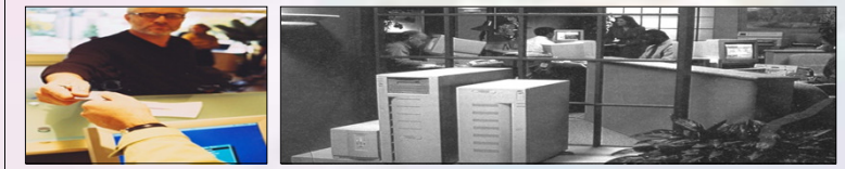
Komputer di front & back office hotel

Di hotel komputer juga sangat berperan dalam mengontrol penggunaan kamar dan pembuatan faktur. Komputer biasanya di pasang di front office dan di back office